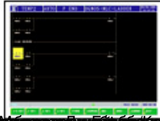
Модельный ряд CNC